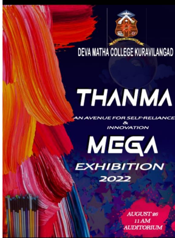
Brochures of THANMA Mega Exhibition and Trade Show 2022